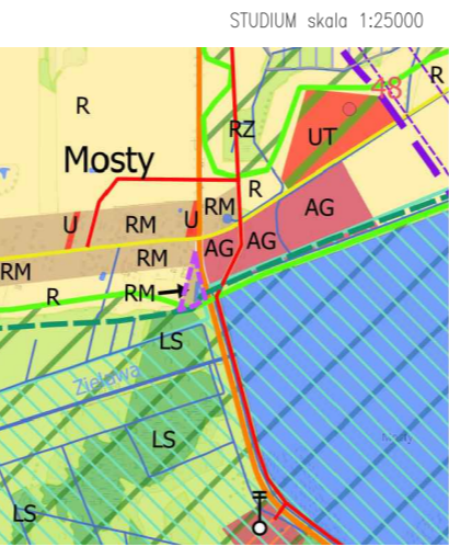
OBSZAR OBJĘTY PLANEM

WYRYS ze STUDIUM UWARUNKOWAŃ I KIERUNKÓW ZAGOSPODAROWANIA PRZESTRZENNEGO GMINY PODEDWÓRZE przyjętego uchwałą nr IV/19/2002 z dnia 30 grudnia 2002 r., zmienionego uchwałą nr XXX/143/2006 z dnia 23 lutego 2006 r., nr IV/23/2011 z dnia 26 stycznia 2011 r., nr XXXII/259/2023 z dnia 28 listopada 2023 r.